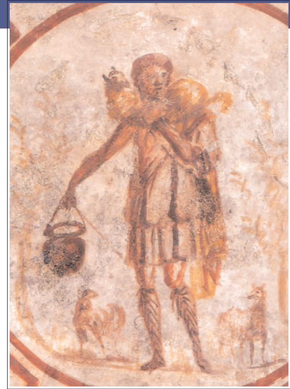
Représentation du Bon Pasteur, sur une voûte des catacombes de Saint-Calixte, peinte par les chrétiens du 3 ème siècle.

menaient une vie normale. Mais le risque du martyre était toujours présent : il suffisait qu'un ennemi porte plainte pour qu'il y ait une enquête. Celui qui se convertissait était pleinement conscient que le christianisme était une option radicale qui entraînait la recherche de la sainteté et la profession de foi au risque de sa propre vie. Chez les fidèles, le martyre était un privilège, une grâce