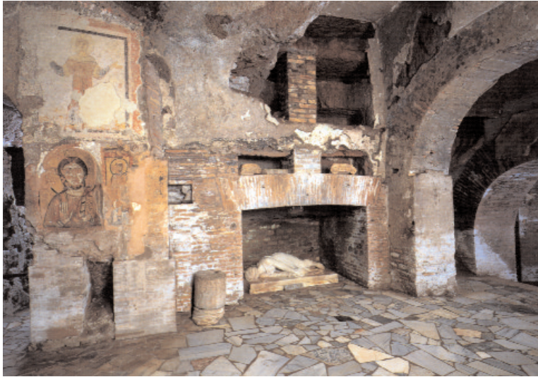
Crypte de Sainte-Cécile.

à la sortie de Rome. Ce fut au 2 ème siècle que l'on commença à y inhumer des morts et les propriétaires du domaine, vraisemblablement chrétiens, permirent que d'autres frères dans la foi y soient enterrés à leur tour. C'est à cette époque-là que fut ensevelie la jeune martyre Cécile, dont la mémoire fut très vénérée dès l'instant de sa mort. Cécilia appartenait à une famille de patriciens et elle se convertit lorsqu'elle était encore très jeune. Elle épousa Valérien qu'elle approcha de la foi, et les deux décidèrent de rester vierges. Puis, Valérien, chargé de retrouver et d'inhumer les restes des martyrs, fut découvert et décapité. Cécile fut dénoncée à son tour. On essaya de l'asphyxier dans un chaudron, chez elle et comme elle s'en sortit, indemne, elle fut condamnée à être décapitée. La loi romaine prévoyait que le bourreau