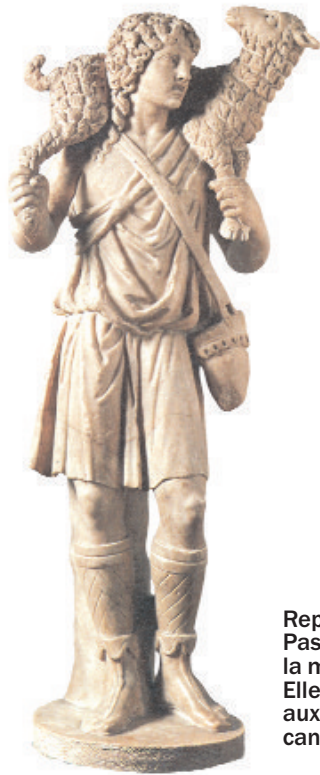
Représentation du Bon Pasteur sculptée vers la moitié du 4 ème siècle. Elle est actuellement aux musées du Vatican.

ses épaules et, arrivé chez lui, il appelle les amis, les voisins et leur dit : Réjouissez-vous avec moi, car j'ai retrouvé la brebis perdue (Lc 15, 5-6) 8 .