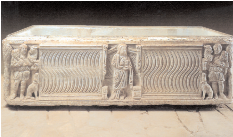
Sépulcre du 4 ème siècle avec deux représentations du Bon Pasteur

incinéré dans l'urbs 2 . Les romains incinéraient habituellement les corps des défunts, mais il y avait aussi des familles qui inhumèrent leurs êtres chers dans leur propriété. Cette coutume s'imposa par la suite sous l'influence du christianisme.