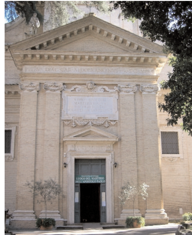
Église de Saint-Paul ad tres fontes , bâtie sur le lieu du martyre de l'Apôtre.

et durant sa captivité, saint Paul pouvait déjà envoyer aux églises les salutations des chrétiens qui vivaient sous le toit de César ( Ph 4, 22). Ces chrétiens de la maison de César étaient des fonctionnaires de l'administration de l'Empire. Les chrétiens de Philippe étaient sans doute ravis de voir que l'Évangile avait touché aussi ces milieux d'où l'on avait la possibilité de travailler à changer la société.