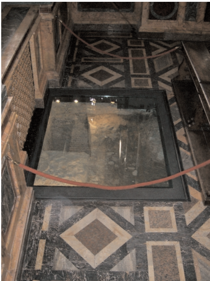
Sous l'autel de la Confessio de la basilique, on a trouvé un sarcophage en marbre. On pense que c'est celui où furent déposés les restes de Saint Paul.