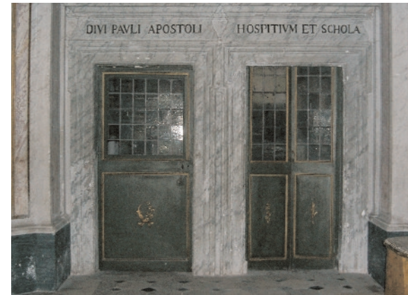
Église Saint-Paul alla Regola , bâtie sur les lieux où, selon une ancienne tradition, se trouvait la maison de Saint Paul.