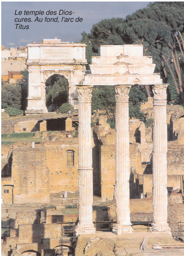
Le temple des Dioscures. Au fond, l'arc de Titus

L'opinion publique de l'époque partageait en une large mesure cette intolérance étonnante envers les disciples du Christ : les chrétiens étaient, pour le moins, des gens particuliers : ils s'efforçaient, bien sûr, d'aider le prochain, d'être fidèles au mariage, de payer les impôts ou d'éviter scrupuleusement toute malhonnêteté dans les