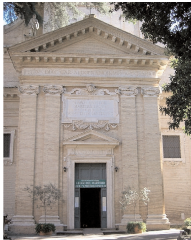
Igreja de São Paulo ad tres fontes, edificada sobre o lugar do martírio do Apóstolo.

um apostolado pessoal, foram fazendo prosélitos e, durante o seu cativeiro Paulo já enviava às igrejas as saudações dos cristãos que viviam na casa de César ( Flp. 4, 22). Esses cristãos da casa de César eram funcionários da administração imperial. Aos cristãos de Filipos, sem dúvida, dava-lhes alegria verificar que o Evangelho também tinha chegado a esses ambientes, de onde tanto se podia fazer para mudar a sociedade.