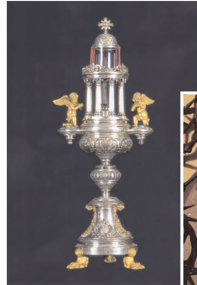
O relicário com o Cravo. Em baixo, os espinhos da Coroa.