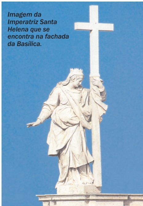
Imagem da Imperatriz Santa Helena que se encontra na fachada da Basílica.

nus, no cimo do Gólgota. Sabe-se que Adriano tinha grande ódio pelo cristianismo no final da sua vida, e é quase certo que a construção desses templos tinha como fim apagar para sempre as marcas terrenas da Redenção.