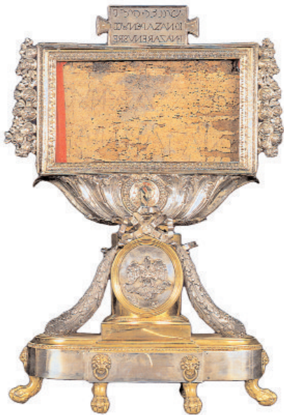
Relicário com o Titulus Crucis. Escreveu-se em hebraico, grego e latim, mas nos três casos da direita para a esquerda.

Santo Ambrósio descreve-no-la com grande vivacidade, caminhando entre as ruínas dos templos romanos acompanhada por soldados e operários. E perguntando-se: Eis aqui o lugar da batalha: mas onde está o troféu da